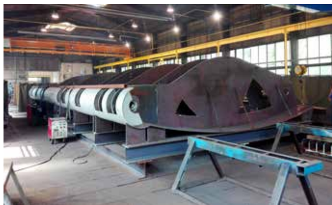
Přelivné klapky pro vodní dílo Nechranice

Vodní nádrž Nechranice se nachází v Ústeckém kraji na řece Ohři a s rozlohou 1338 ha se jedná o pátou největší vodní nádrž v České republice a také o přehradní nádrž s nejdelší sypanou přehradní hrází ve střední Evropě (3280 m). Tato vodní nádrž byla vybudována v letech 1961 až 1968 zejména jako zdroj vody pro nedalekou elektrárnu Tušimice. Strojírny Podzimek s.r.o. se staly ve sdružení s firmou SMP CZ realizátory rekonstrukce polí bezpečnostního přelivu. Naším úkolem je vyrobit a namontovat dva kusy nových přelivných klapek a příslušenství levého a pravého pole bezpečnostního přelivu. Obě klapky budou pracovat plně automaticky za pomoci 4 kusů hydraulických válců. První kus klapky pro levé přelivné pole je v tuto dobu vyráběn v areálu naší firmy v Třešti. Za zmínku stojí povrchová úprava konstrukce. Celková tloušťka nátěru je 1 mm a provádí se „za tepla“.