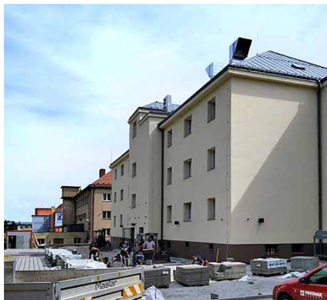
Budova Integrovaného centra sociálních služeb

Je začátek srpna a my se pomalu s výstavbou Integrovaného centra sociálních služeb v Jihlavě blížíme k cíli. Pevně věříme,