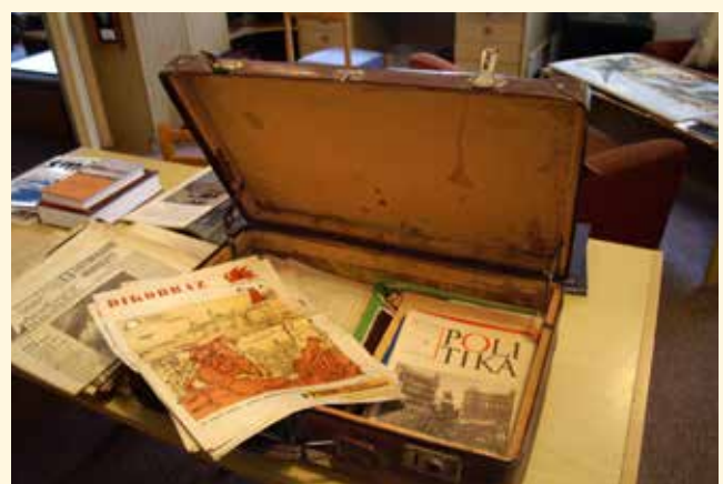
Otevřít za dalších 50 let