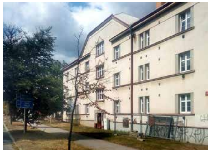
Centrum sociálních služeb Jihlava