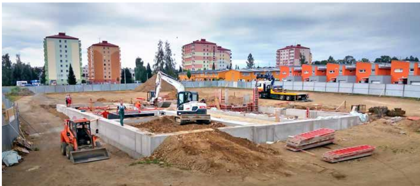
Staveniště MŠ Na Dolech

Během dubna jsme provedli většinu bouracích prací a výkopů pro podlahové konstrukce. Na ně jsme navázali provedením provětrávaným systémem iglů. Během května jsme dokončili vyzdívky, hrubé podlahy, osadili nová okna rozvody elektro a ZTI a zahájili omítky. V červnu jsme sanační omítky dokončili, vymalovali, zadláždili, obložili, osadili vzduchotechniku, zkompletovali elektro a zdravotnickou, provedli podhledy, na podlahu nalili epoxidovou stěrku, nasadili dveře, zamkli a předali. V srpnu proběhnou kolaudace. Díky všem co se na zakázce podíleli, že to klaplo.