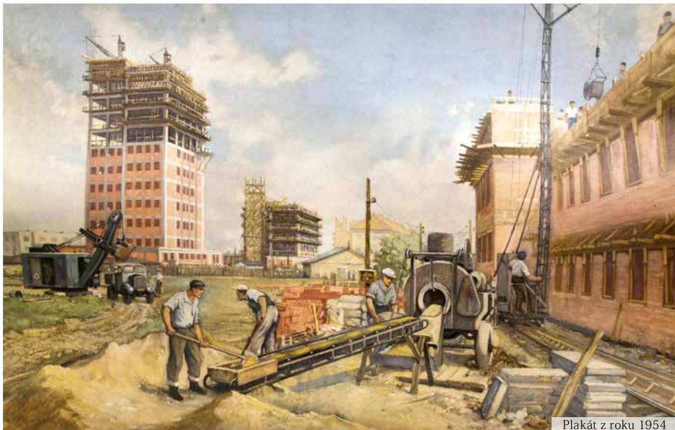
Plakát z roku 1954