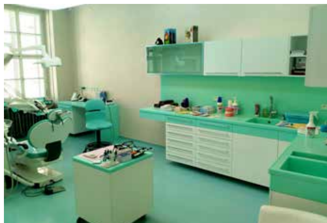
Interiér dentální kliniky STOMAMED

Pracovníci HI-MACS dílny pracovali v červenci a srpnu na dvou větších a několika menších zakázkách pro zákazníky v Čechách a na Slovensku. Větší zakázka pro dentální kliniku STOMAMED v Bratislavě zahrnovala výrobu a montáž vrchních desek se dřezy pro linky ve třech ambulancích, desky pro psací stoly a vrchní desky pojízdných boxů. Zákazník si vybral HI-MACS materiál Emerald lehké zelené barvy, který je jednotný ve všech ambulancích kliniky.