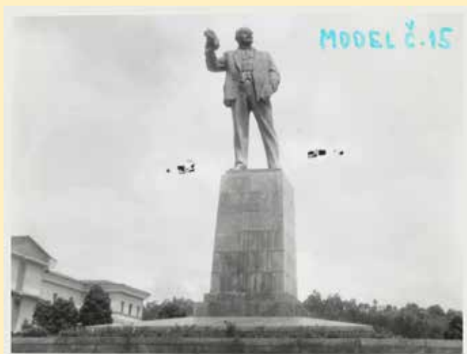
socha V. I. Lenina,