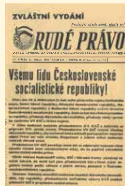
Zvláštní vydání Rudé právo

(Práce, 21. 8. 1968) Předsednictvo ÚV KSČ