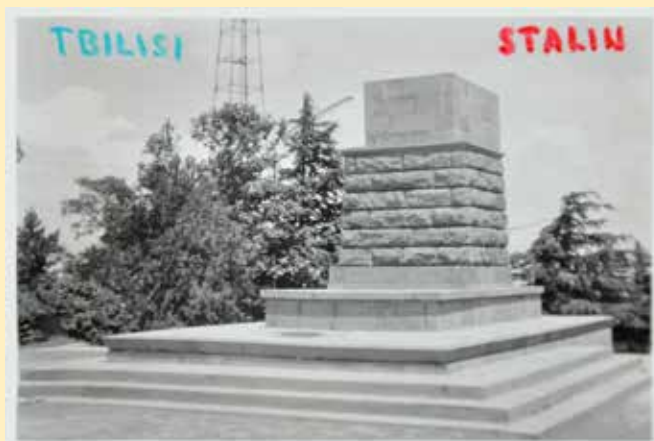
podstavec od sochy J. V. Stalina,

Před odletem jsme ještě navštívili město Tbilisi. Již nákup jízdenky do Tbilisi na nádraží v Soči stojí za zmínku. Fronta byla veliká a s každým zájemcem po otázce kam chce jet, začala diskuze proč, a jestli nechce jet jinam. Debaty byly nekonečné a tato fronta stále narůstala. Po zakoupení jízdenky jsem se zeptal, v kolik hodin vlak přijede zpět. Odpověď mě víc než zarazila: „To záleží, jaký bude mít lokomotiva uhel.“ Nechápal jsem. Odpověď zněla: „Bude-li uhel dobrý, vlak přijede na čas. Bude-li uhel špatný, tak vlak může mít až několik hodin zpoždění.“ Nevěřil jsem svým uším, ale realita po návratu byla ještě kurióznější. Uhel byl asi dobré kvality, a tak jsme zpět do Soči přijeli asi o hodinu dříve. Krátce po tom, co jsem si zakoupil jízdenku, prodavač dal před sebe tabulku „zakryto“ a okénko zavřel. Představoval jsem si, jaké by to vyvolalo protesty u nás. Ne tak v Soči.