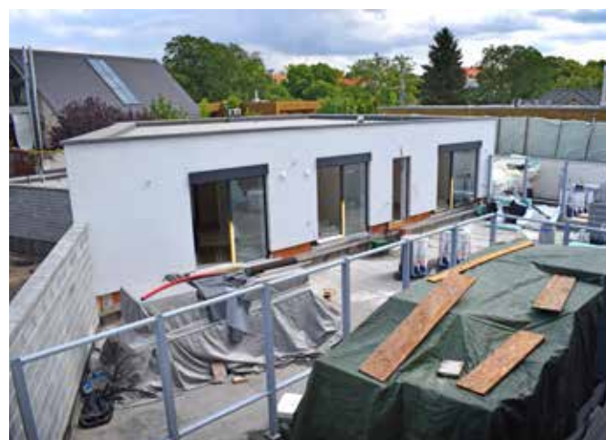
Bytový dům Butovická

Kolaudace stavby bytového domu nedaleko Prokopského údolí je plánována na konec září letošního roku. V polovině srpna byly hotové izolace a probíhala montáž fasády, kdy na svislé úhelníky a následnou vrstvu hydroizolace byly