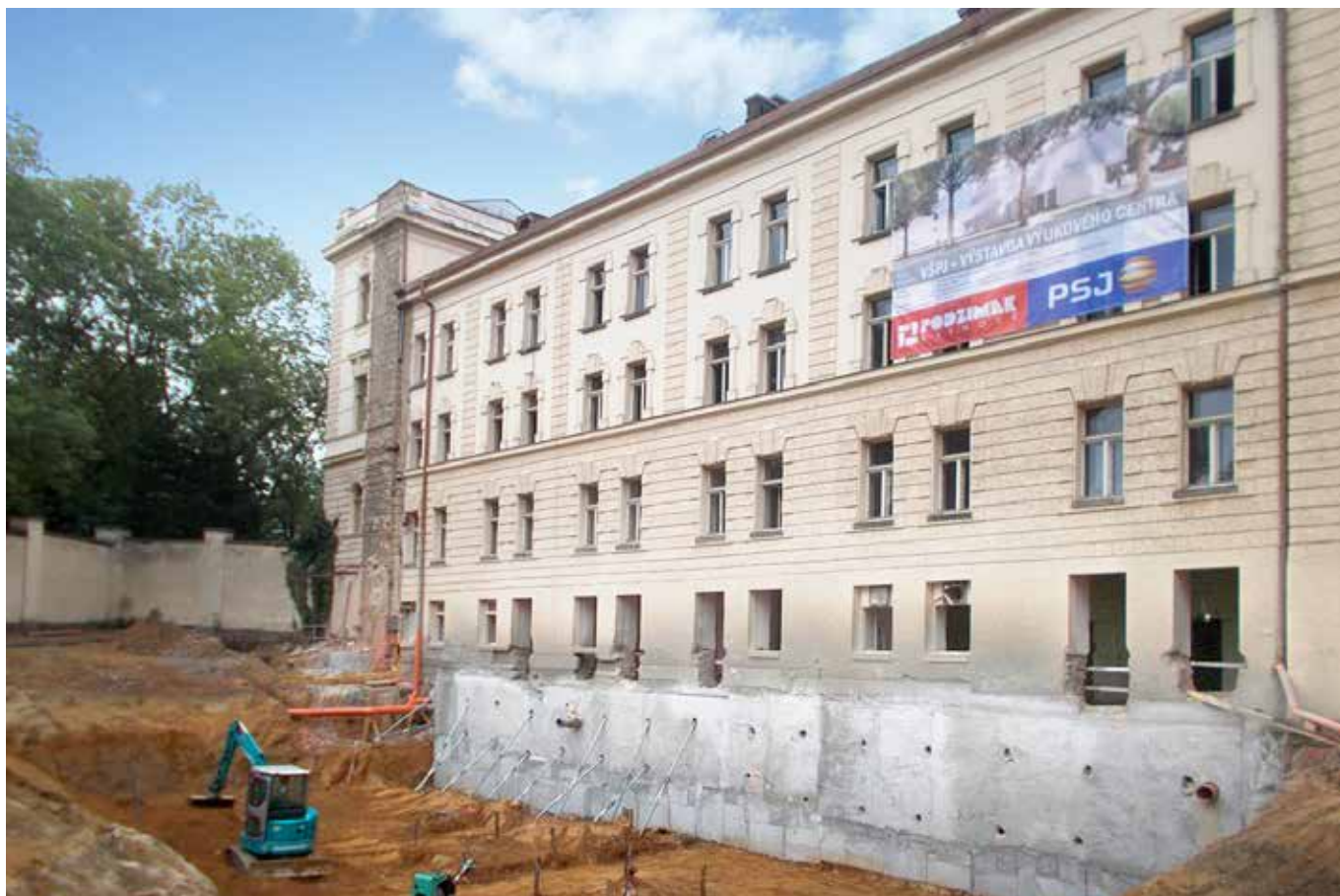
Vysoká škola Polytechnická Jihlava

že v době, kdy čtete tento příspěvek, bude stavba zdárně dokončena a zároveň i zkolaudována. V současné době probíhají především kompletace zařizovacích předmětů, koncových prvků vzduchotechniky a elektroinstalace. Dále jsou osazovány interiérové dveře, finalizují se malby a nátěry, montáže ochranných lišt a madel na chodbách. Vzhledem k charakteru objektu jsme bojovali se značnou vlhkostí podlahových konstrukcí. Některé dodávky, především pokládka PVC podlahových krytin a koberců, se nám proto mírně zpozdily. Dále se intenzivně soustředíme na dokončování venkovních úprav a zpevněných ploch, které si převážně provádíme vlastními pracovníky. Na pokládku zámkové dlažby, které je bezmála 800 m 2 , jsme s vypětím všech sil sehnali subdodavatele. Závěrem budou osazeny dva zahradní altány, herní prvky a lavičky v severní části pozemku. Průběžným zpracováváním víceprací a méněprací jsme se dostali na celkový počet 65 změnových listů v celkové hodnotě 4 mil. Kč a uzavřeli jsme s investorem čtyři dodatky ke smlouvě o dílo. Zakázku dokončují Pavel Podolský, Tomáš Pěnička, Jan Polák a Jitka Vinterová.