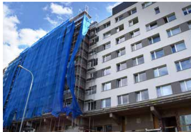
Bytový dům Roháčova

V neutěšené dopravní situaci pražského Žižkova je v mírném předstihu realizován další z projektů revitalizace panelových domů, tentokrát na adrese Roháčova 34 až 44, kde byla v polovině srpna již vyměněna okna ve společných prostorách domů, vstupní dveře a dokončena byla jedna část fasády, druhá část by pak měla být hotova v polovině září. Konec celé stavby je plánován na leden 2019. Realizační tým čeká ještě betonáž průchoďů mezi domy a nových obchodních prostor, které vznikly ubouráním části ochozů zmíněných domů. Závěrečnou fází budou potom terénní práce a vybudování přilehlých komunikací.