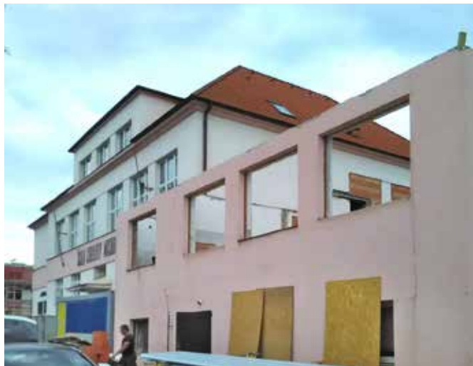
ZŠ Charlotty Masarykové

Jedná se o novou stavební akci pražského výrobního střediska, která byla zahájena 25. 6. t.r. a jejímž předpokládaným termínem předání by měl být červenec příštího roku. Předmětem projektu je dobudování dalších dvou pater na stávající budově jídelny, vedle které nově vyroste ještě tělocvična s patrem učeben. Tělocvična bude zčásti zahlobená pod zem, takže pohledově budou nadzemní část stavby tvořit jen dvě patra. V polovině srpna na stavbě skončily bourací práce ve staré budově a začaly zemní práce spolu se speciálním zakládáním pro stavební jámu tělocvičny.