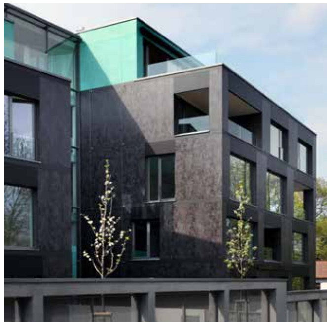
Villa Atrium Bubeneč