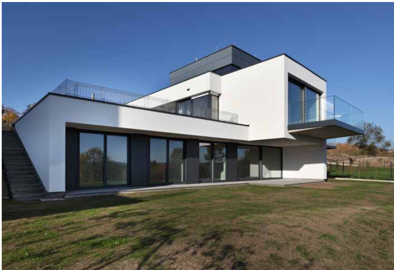
Developerský projekt Radotínské vyhlídky.