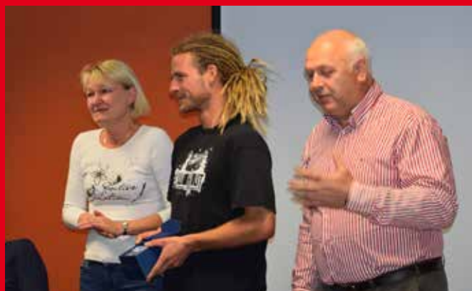
Soutěžení ve firmě 2017