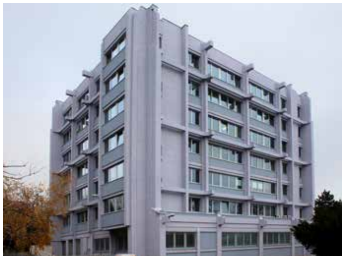
Budova Pražské správy sociálního zabezpečení

Projekt rekonstrukce objektů je za námi, konec listopadu byl předávacím termínem stavby, během které byl rekonstruován obvodový plášť budovy, vybudována plynovodní přípojka pro nové plynové topení, kompletně