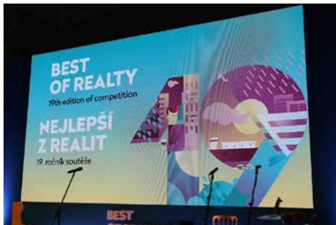
Oficiální logo akce BEST OF REALTY 2017

Na slavnostním galavečeru byly 7. listopadu 2017 v Praze v Kongresovém centru České národní banky vyhlášeny výsledky a předána ocenění nejlepším projektům českého realitního trhu za uplynulý rok. O vítězích 19. ročníku soutěže Nejlepší z realit – Best of Realty, která se v tuzemsku považuje za nejprestižnější ve svém oboru, rozhodla osmičlenná odborná porota.