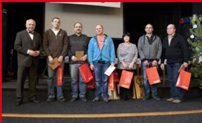
Vyhodnocení nejlepších pracovníků v dělnické profesi 2016