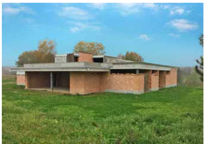
Rodinný dům v Havlíčkově Brodě

Začátkem listopadu jsme převzali staveniště nové zakázky rodinného domu v Havlíčkově Brodě. Jedná se o dostavbu a vybavení objektu o třech podlažích s plochou cca 950m 2