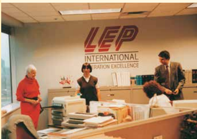
V kancelářích LEP International