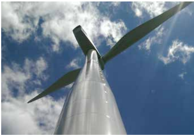
Větrná elektrárna Václavice

Pro investora Vestvix, jsme v období 8/2017 ve spolupráci s našimi subdodavateli zrealizovali technickou infrastrukturu napojení optickými kabely 13 VTE elektráren. Během 5 pracovních dnů jsme realizovali zakázku od technické podpory, zafukování 12 800 m optického kabelu, až po instalaci optických rozvaděčů a svaření 340 optických vláken. Úspěšná spolupráce pokračuje i nadále a to přípravou projektu dalších 29 VTE elektráren, kde se podílíme na technických konzultacích připravovaného projektu.