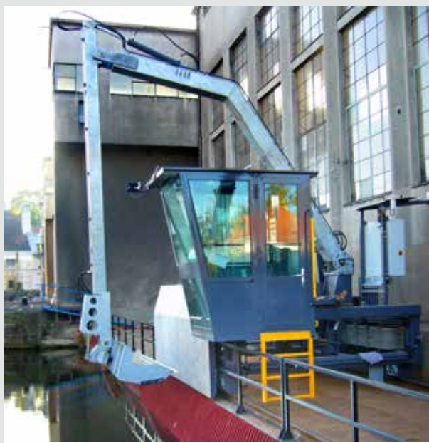
Vodní elektrárna Brandýs nad Labem

Česká podnikatelská skupina Energo-Pro známého miliardáře Jaromíra Tesaře zakoupila na konci loňského roku vodní elektrárnu o výkonu 2,7 MW v Brandýse nad Labem.