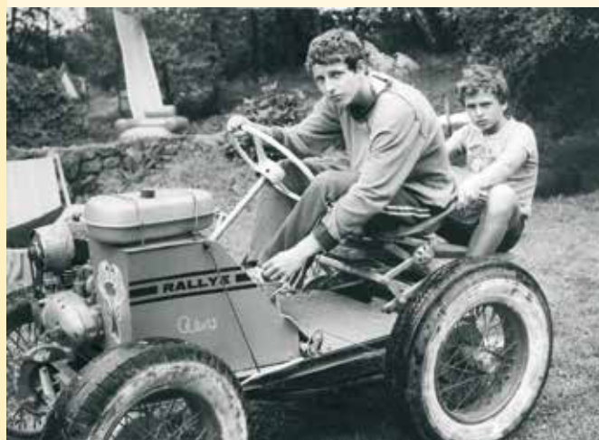
První terénní auto, které sami řídili naši kluci

které sami řídili, vybudovali si malé hřiště s tribunou pro rozhodčího a pomáhali při stavbě bazénu s vlastním filtrem a solárním ohřevem.