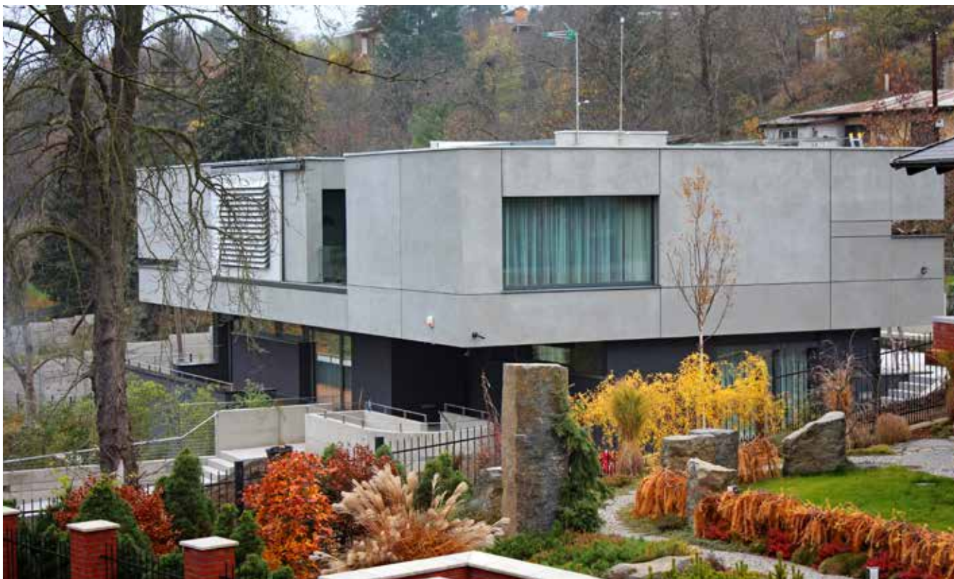
Rodinný dům v pražské Troji

Na projektu hostovského domu Andrea a stájí Tereza v Šáreckém údolí jsme se dostali do finále. Aktuálně probíhá stavba seníku, což je dřevostavba, dále se dokončují pozemní komunikace a monolitická konstrukce mostku. Datum