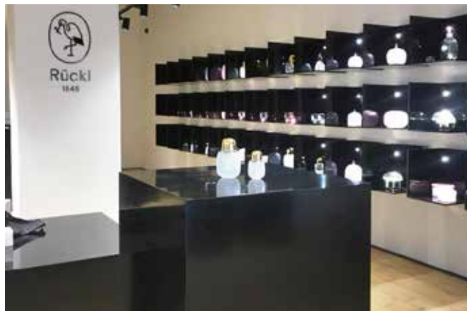
Interiér značkové prodejny sklárny Rückl

Se stavaři jsme spolupracovali jako subdodavatelé i na projektu RD Troja, kam jsme dodávali jednak parapety z umělého kamene Hi-macs®, jednak dřevěné podlahy na dvě terasy, obložení fasády terasy ve druhém patře a obložení vřívkvy, vše z dřeviny Garapa.