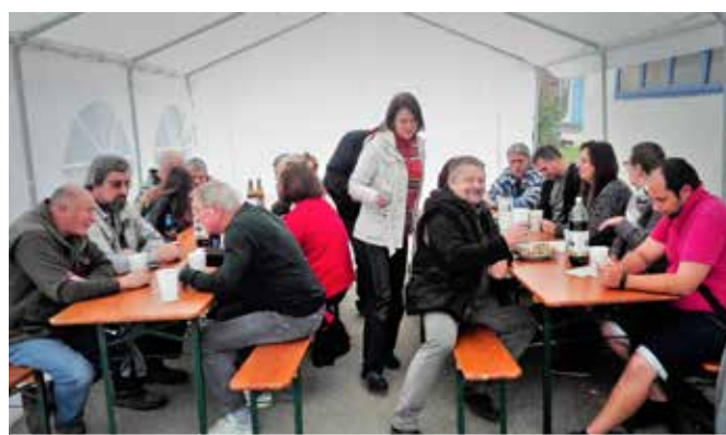
Účastníci Ukončení léta v areálu Strojíren Podzimek

Patnáctý zářijový den jsme se sešli na grilování, které pořádáme tradičně, letos již pošesté. Opékané kytý provoněly náš areál už v dopoledních hodinách tak, až se všem sbíhaly