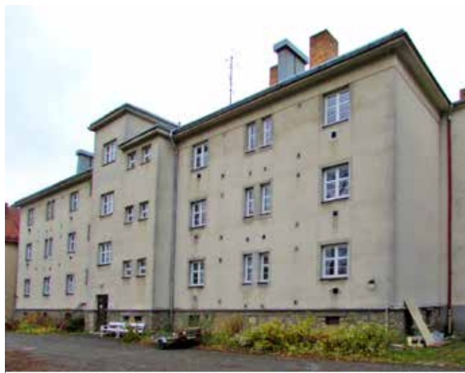
Objekt Integrovaného centra sociálních služeb

Začátkem listopadu jsme také převzali staveniště pro rekonstrukci Integrovaného centra sociálních služeb. Původní objekt byl postaven ve 20. letech 20. století a je tedy jasné, že opravu již více než potřebuje. Jedná se o čtyřpodlažní objekt, a to s jedním podzemním a třemi