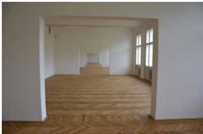
Podlahy Muzea v Mostě