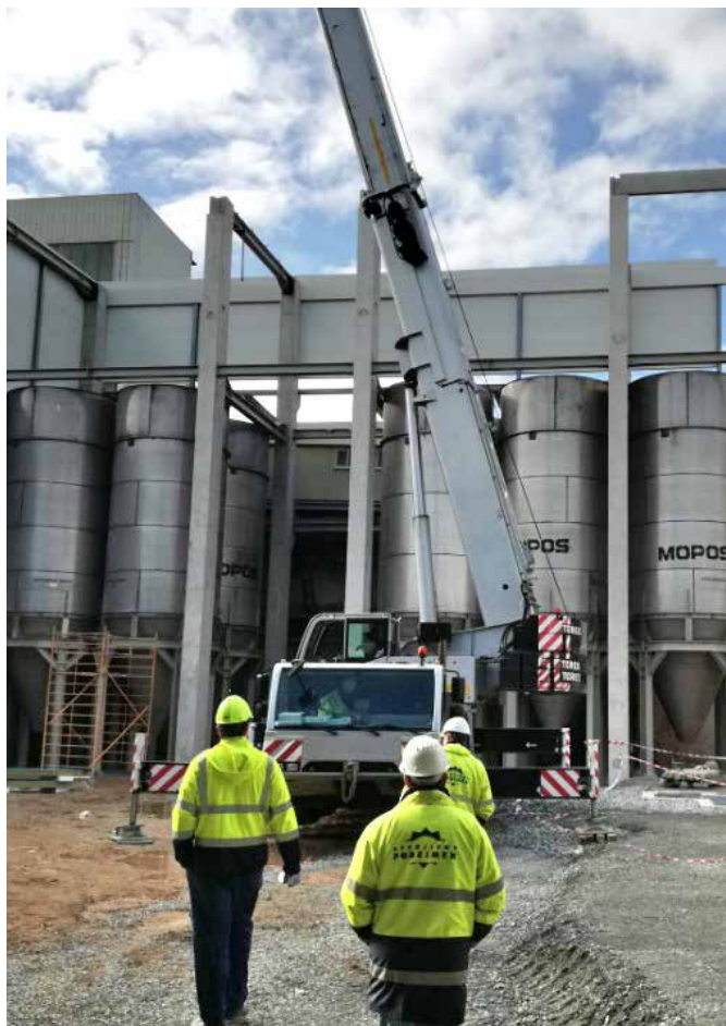
Zahájení montážních prací v Chlumčanech