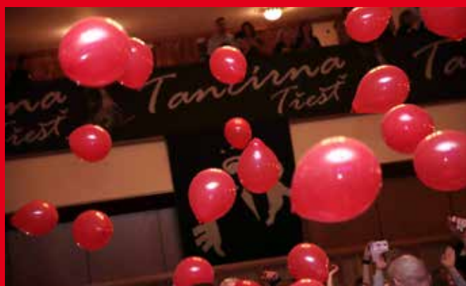
Tančírna Třešť 2017