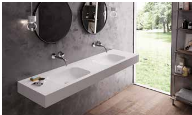
Realizace koupelnové desky

Od letošního října rozšířila firma Polytrade CE nabídku dřezů a umyvadel z materiálu Hi-macs®, které dodává přímo výrobce desek společnost LG Hausys. V současné době si tak zákazník může vybrat z 35 různých tvarů umyvadel a dřezů. Většina z nich (kromě tří volně stojících) je určena pro plynulé zapracování do kuchyňské nebo koupelnové desky. Díky nenasákavosti a bezesparému spojování a možnosti různého tvarování vyhovuje vzniklý celek vysokým hygienickým nárokům. Díky snadnému čištění, zdravotní a chemické nezávadnosti nachází takto vyrobené desky uplatnění nejen v koupelnách a kuchyních, ale stále častěji v provozech s přísnými hygienickými požadavky – nemocniční prostory, laboratoře, potravinářské provozy.