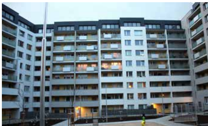
Objekt Sabinova, Praha

Žižkovský projekt byl oficiálně předán 6.10. s tím, že do 6.11. probíhalo odstranění nedodělků. Předmětem díla byla rekonstrukce a zateplení fasád bloku panelových domů, výměna střešní krytiny, oplechování nástavby a vzduchotechniky ve střeše. Ve střešních ateliérech byly zrekonstruovány podlahy a omítky. Součástí dodávky byla i úprava vnitrobloku včetně osazení herních prvků, výsadby