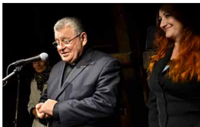
Kardinál Monsignor Duka otevírá Výstavu betlémů