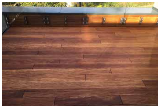
Terasa rodinného domu v pražské Troji

navázali na zdařilé použití Pallmann X-light systému v Hotelu Imperial a v Aria Hotelu Prague. Tyto zakázky jsou pro nás významnou referencí do budoucna, neboť jsme tento extrémně zátěžový lak vytvrzovaný přímo v místě realizace speciálními UV lampami s velkým úspěchem využili již na páté naší zakázce, a to jako jediní v celé ČR.