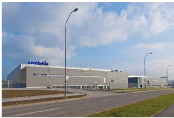
Hala firmy Swoboda-Stamping

S koncem prázdnin se stavba haly pro firmu Swoboda–Stamping dostala do finále. Po dokončení podlahy najely do haly na dvě desítky plošin a pokračovali jsme na všem, co jsme museli vzhledem k drátkobetonové podlaze přerušit. Rozvody vzduchotechniky, silnoproudu, slaboproudu, MaR, chlazení, stlačeného vzduchu a malby jely na „plné pecky“, tak abychom mohli 30. září konstatovat splnění dílčího termínu a umožnili investorovi stěhování strojů do haly. Po dokončení haly jsme se vrhli na obě administrativní části. V září a na začátku října se dokončily obklady a dlažby, pokládka PVC, minerální podhledy, výplně otvorů. Venkovní plochy ze zámkové dlažby a fasádní obkladové panely se