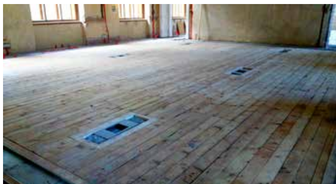
Podlaha v budově Národního muzea Praha

Změnou oproti letům minulým je znatelné vyhocení personální otázky. Stejně, jako v současnosti většina firem, se potýkáme s problematikou udržení a motivace stávajících kvalitních zaměstnanců a s téměř nemožností získání kvalitních zaměstnanců nových, které bychom potřebovali pro rozšíření týmu vzhledem k narůstajícímu objemu zakázek.