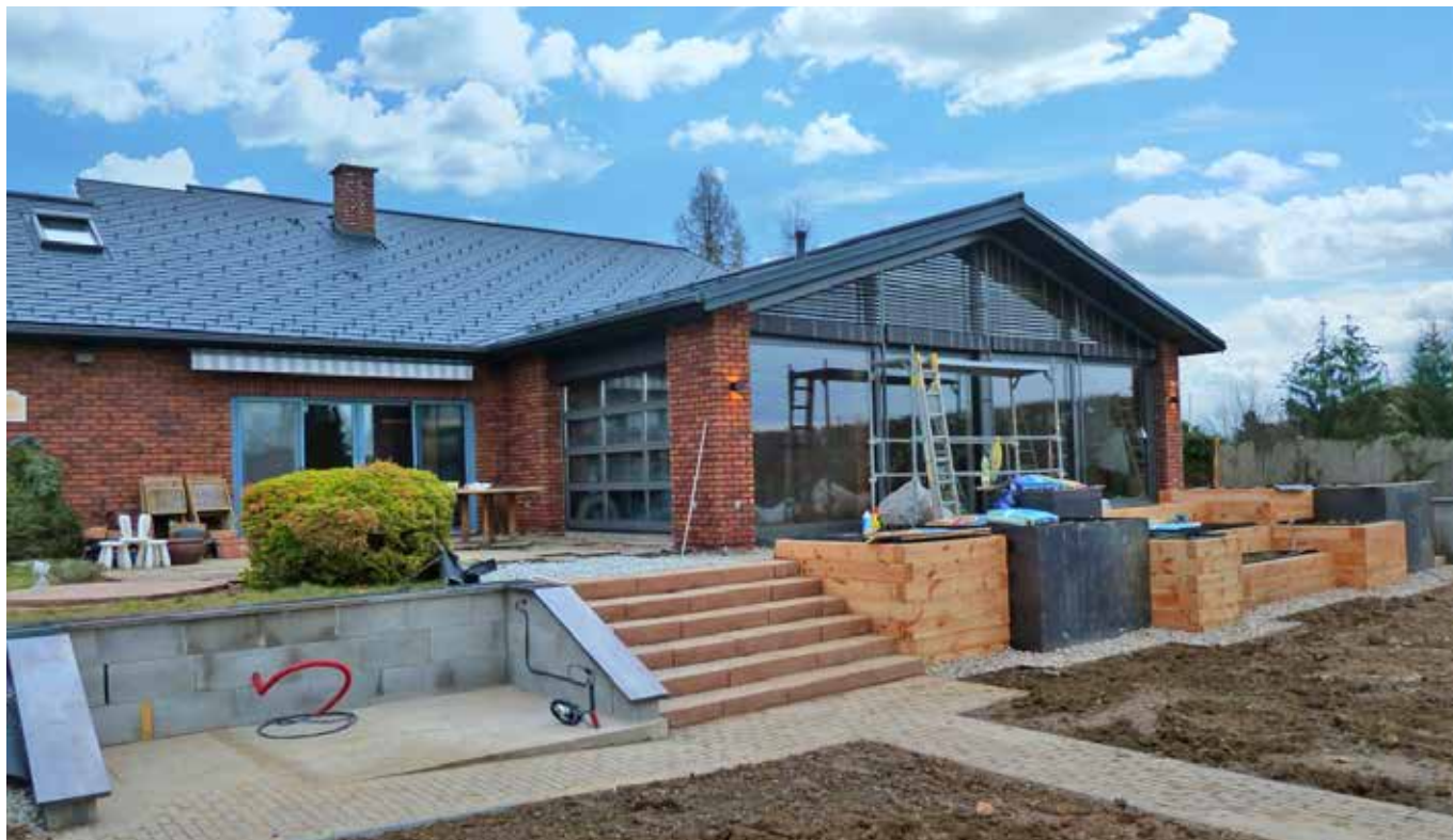
Rodinný dům Müller