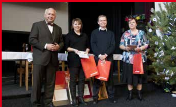
Vyhodnocení nejlepších pracovníků v technické profesi 2016