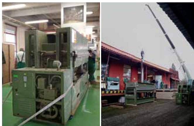
Výměna lisu v provozovně Dřevovýroby Podzimek

Dalšími zakázkami realizovanými v poslední třetině roku byly ve spolupráci se stavební výrobou v Praze – dodávka dveří do apartmánhotelu v Thunovské ulici. Zde jsme zároveň, již samostatně, získali zakázku na dodávku kuchyňských linek.