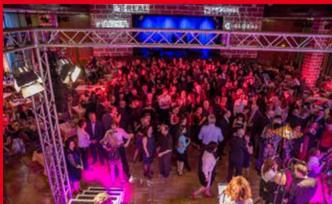
Tanec stavařů 2017