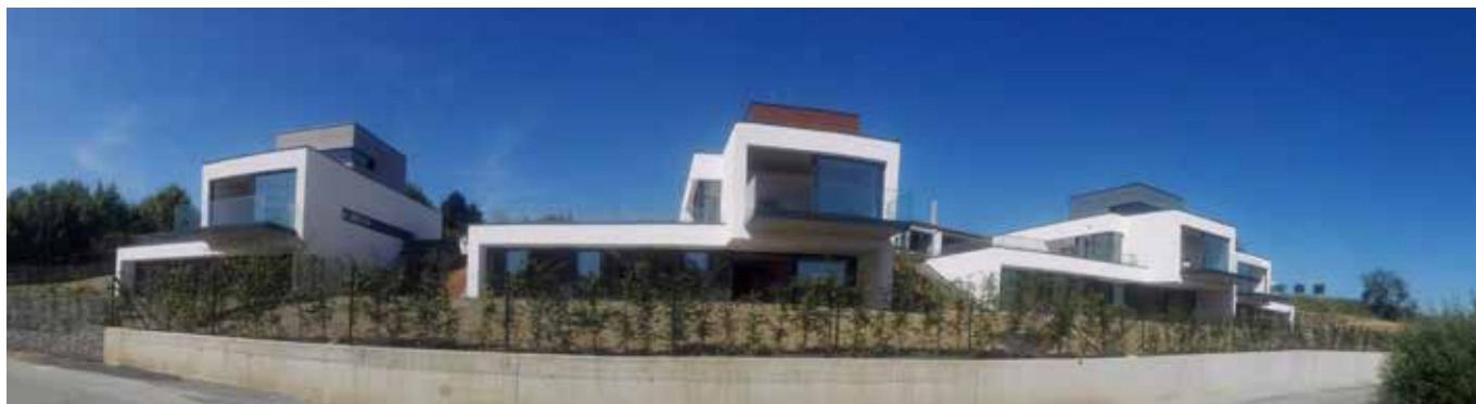
Rodinné domy Radotín