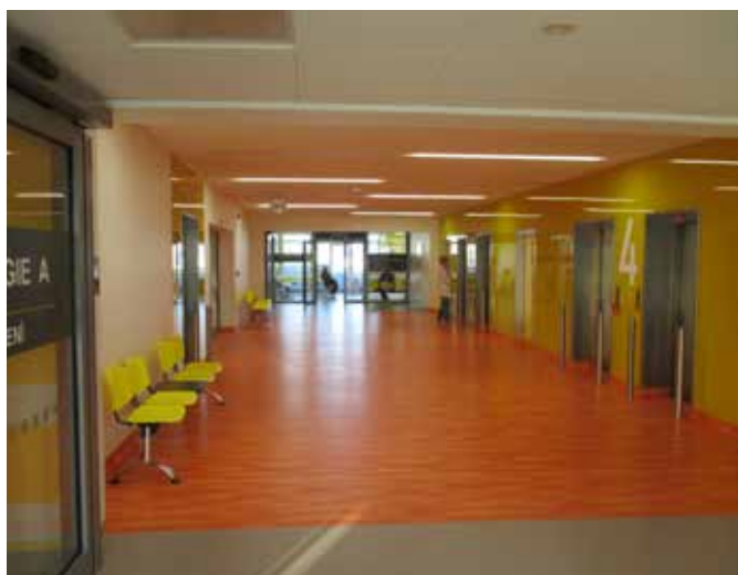
Nemocnice Jihlava - pavilon interny

Páté patro předané, 4.NP před dokončením a 3.NP rozbité... Již druhým rokem probíhá za zdi interního pavilonu krajské Nemocnice Jihlava jeho komplexní rekonstrukce. Třetí etapa byla kolaudována začátkem letošního června, což následně umožnilo stěhování onkologického oddělení do svého