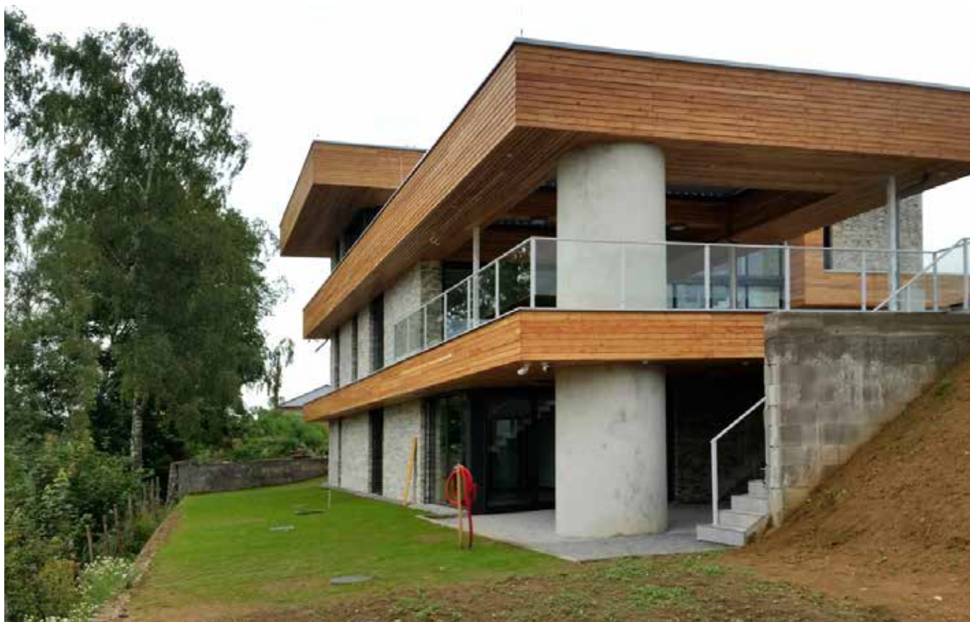
Rodinný dům Horní Kosov