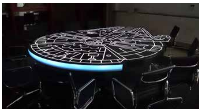
Stůl jako vesmírná loď ze Star Wars

V minulých měsících jsme dokončili velice zajímavou zakázku do Trenčína. Celá tato zakázka se skládala ze tří částí a nesla se ve stylu Star Wars. První částí byla stolová deska ve tvaru vesmírné lodě. Druhá část ve tvaru levitujícího krystalu a poslední částí byla komoda. Vše je umístěno v jedné místnosti a tvoří zajímavý celek.