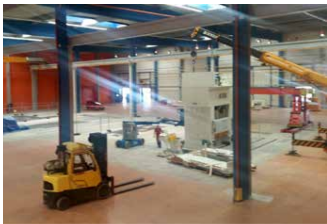
Úprava haly pro Lemtech Jihlava