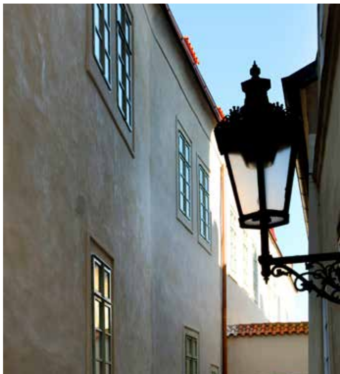
Rezidence U Zlatého kapra