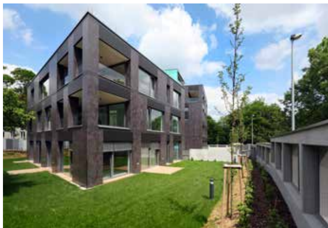
Villa Atrium Bubeneč