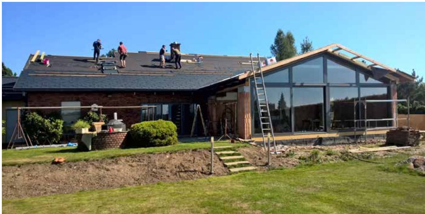
Jasmínová 1, Jihlava

o demolici přístavku rodinného domu s původním bazénem a výstavbou nové podsklepené části rodinného domu, ve které se do budoucna bude nacházet fitko s koupelnou a letní kuchyně. Na tuto část bude navazovat i venkovní terasa. Jako poslední bude kompletně vyměněna střešní krytina i na stávajícím objektu. Termín dokončení je plánovaný na říjen 2017. Stavbu realizuje Honza Polák.