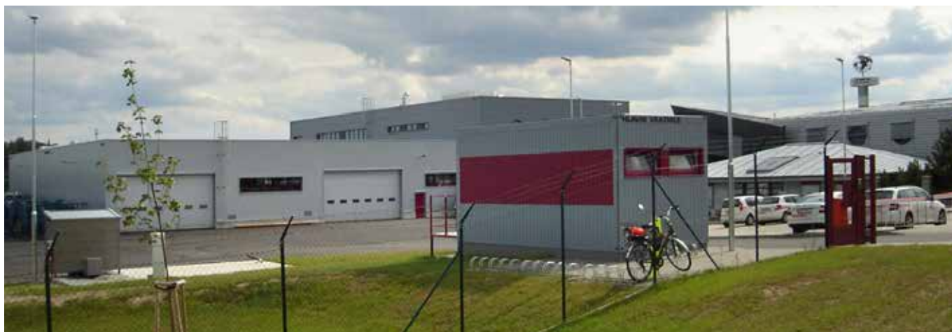
Budova DAFE-Plast Polná