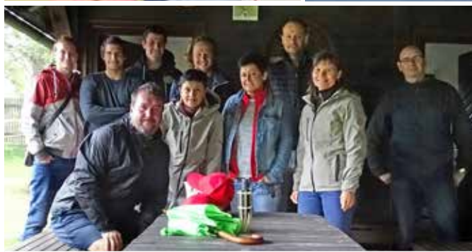
Účastníci a vítězové bowlingového turnaje