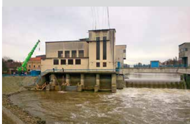
MVE Brandýs nad Labem

V současné době se rovněž průběžně projekčně a dodavatelsky podílíme na celkové rekonstrukci MVE Brandýs nad Labem, kde kromě již probíhajících dodávek