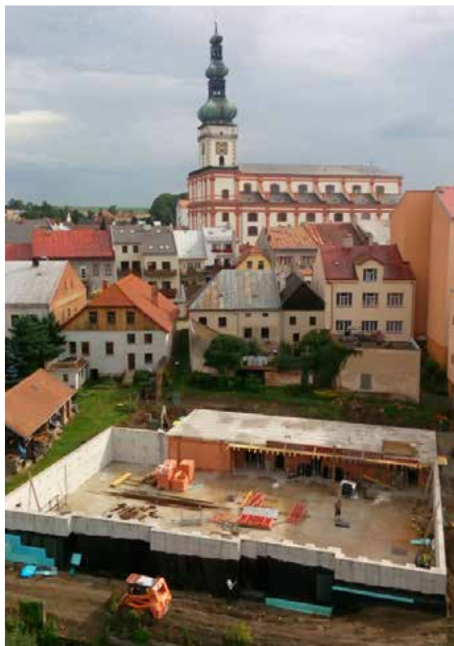
Budoucí tělocvična v Polné