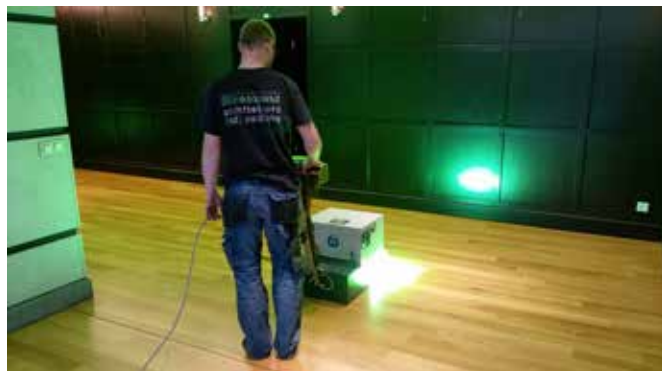
Práce s UV vytvrzovací lampou

V současné době máme za sebou realizaci dalších tří zakázek, kde jsme použili v minulosti již zmiňovanou technologii v lakování parketových podlah – speciální „UV - lak“ – PALLMANN X-LIGHT SYSTÉM. Repasi stávající podlahy v místě s novou povrchovou úpravou jsme prováděli v prostorách baru prestižního ARIA HOTELU PRAGUE na Malé Straně a v prostoru Knižní kavárny na Václavském náměstí, která se tento rok prováděla již ve druhé etapě. Třetí z akcí je pokládka nových parketových čtverců vzoru Vídeňský kříž, včetně hrubé podlahy z OSB desek, která proběhla v zasedací místnosti Střediska společných činností AV ČR na Národní.