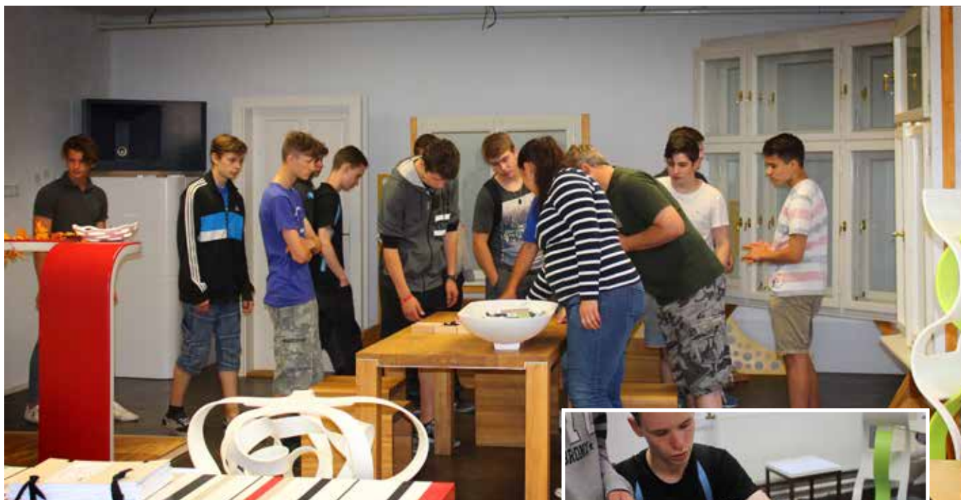
Posluchači stavební školy v interiérech firmy Podzimек