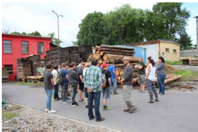
Posluchači stavební školy v areálu firem Podzimек