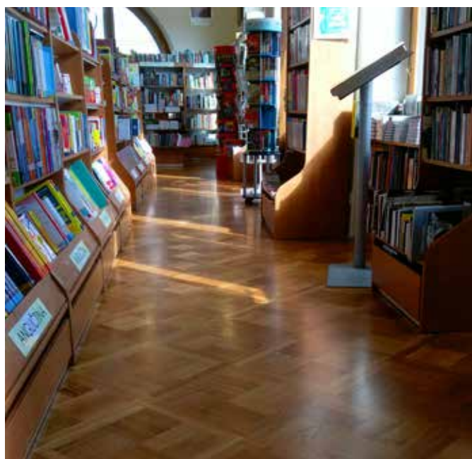
Interiér Knižní kavárny

Naší nejbližší podzimní akcí je výměna vlysových podlah Oblastního muzea v Mostě. Pokládat se zde budou repasované vlysy, jejichž demontáž proběhla začátkem srpna a odborná repase v mezidobí, a nově vyrobené repliky stejného rozměru a v odpovídající kvalitě. Výměna se týká i stávající hrubé podlahy a veškeré práce probíhají za důkladného dozoru místních památkářů.