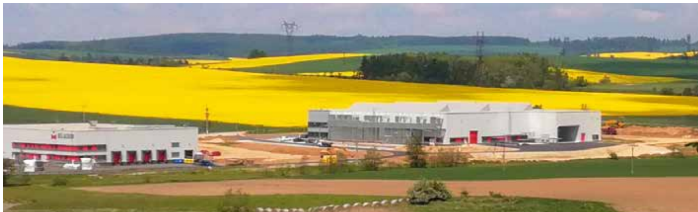
Objekt firmy Tirad Šašovice