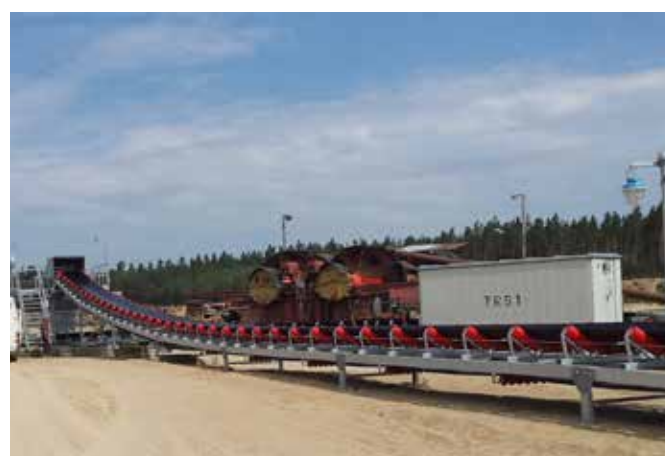
Pásový dopravník pro LB Minerals s.r.o.