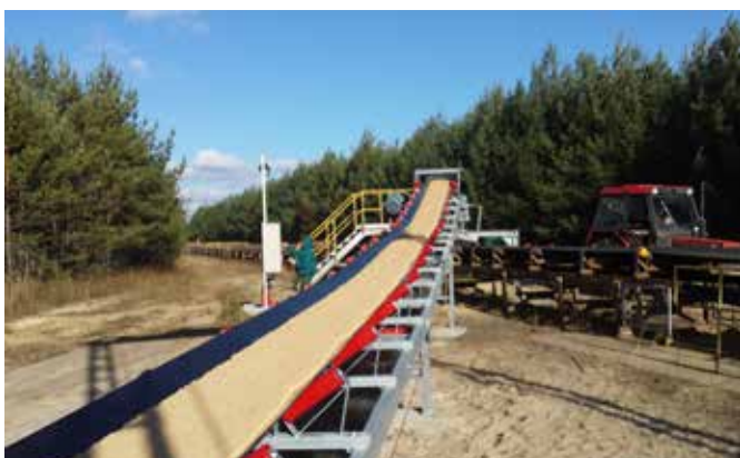
Pásový dopravník pro Kerkosand spol. s r.o.

V letošním roce jsme realizovali dodávku a montáž dvou podobných kusů „Pozemních pásových dopravníků“, pro naše dlouholeté zákazníky.