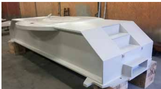
Nátěry dílů turbíny MVE Brandýs nad Labem